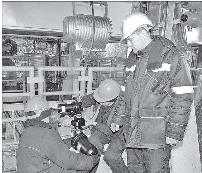
На «Приразломной» полным ходом идут работы